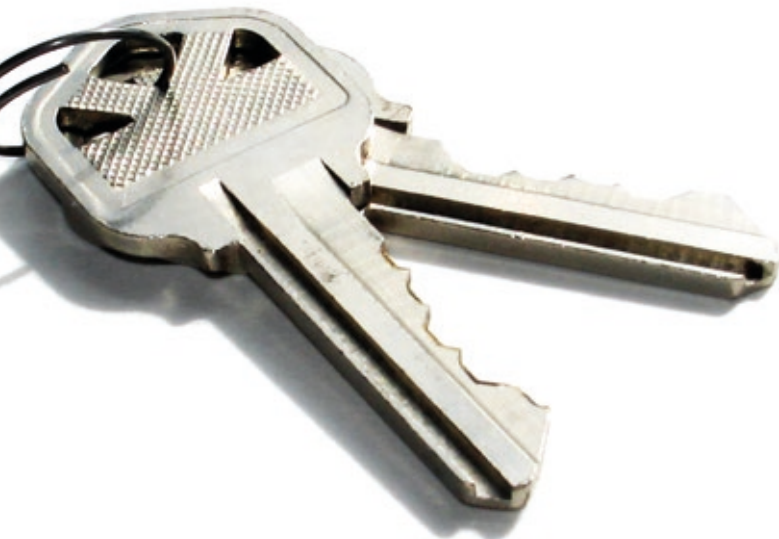
Eloy Yáñez Abogado

Finalmente, como otra cuestión relevante, resulta llamativa la reforma que se opera en relación con los denominados pisos turísticos, siendo que la reforma operada busca al efecto empoderar a las comunidades de vecinos a fin de poder regular o limitar este tipo de arrendamientos, siempre que lo aprueben tres quintas partes de los propietarios.